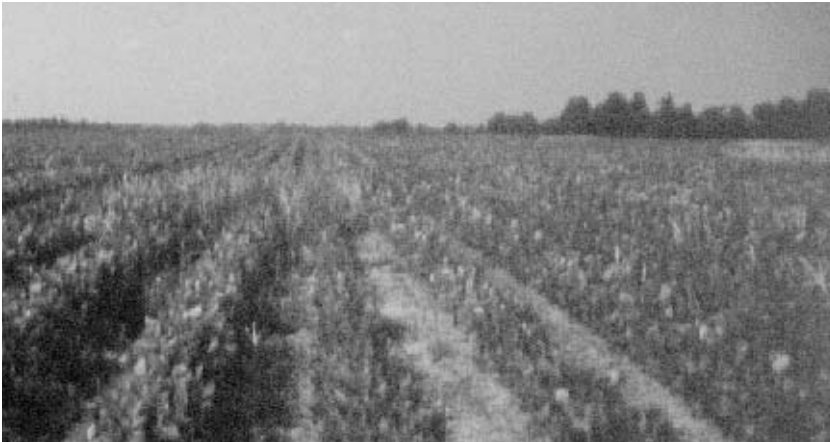
Campo de soja Roundup Ready en siembra directa.

que el herbicida Roundup es altamente eficaz contra la gran mayoría de las hierbas anuales y perennes y contra malas hierbas de hoja ancha, los agricultores que sembraron variedades de soja Roundup Ready han sido capaces de reducir el número de herbicidas usados para controlar las malas hierbas que crecen en sus campos, lo que supone un ahorro en los costes del control de las malas hierbas. Esta reducción en el uso de herbicidas ha beneficiado al medio ambiente al reducirse el número de aplicaciones de herbicida y también permite a los agricultores realizar un control integrado de las malas hierbas en sus campos, más difícil de implementar cuando se utilizan herbicidas de efecto residual aplicados antes de la siembra, o en preemergencia del cultivo. También ha facilitado la adopción de la agricultura de conservación, reduciendo el laboreo mecánico y emisiones de CO 2 , y manteniendo sobre el suelo los restos vegetales para evitar la erosión.